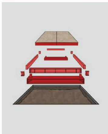
②桁受け、覆工受け、覆工板を設置していきます。溶接プレートを設置し、各部品を規定トルクにてボルト固定していきます。