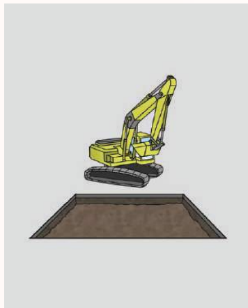
①路面覆工の寸法に応じて、舗装切断工を行ってください。