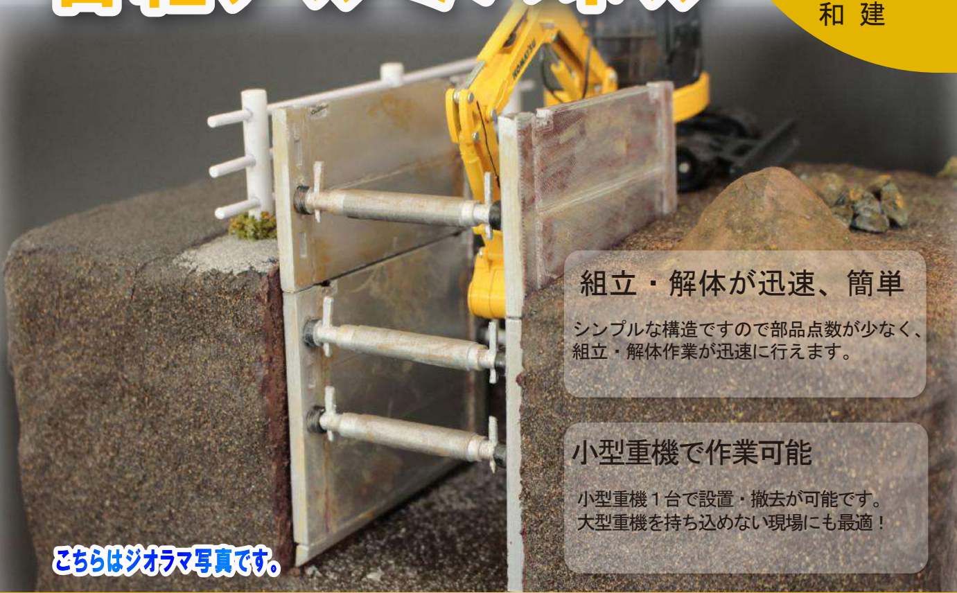
こちらはジオラマ写真です。