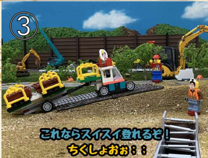
これならスイスイ登れるぞ！ ちくしょおお；；