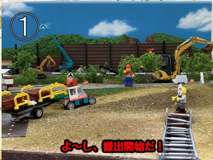
よーし、搬出開始だ！