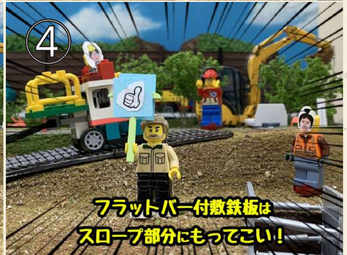
フラットバー付敷鉄板は スロープ部分にもってこい！