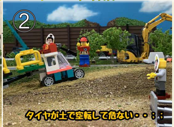
タイヤが土で空転して危ない。。。；；