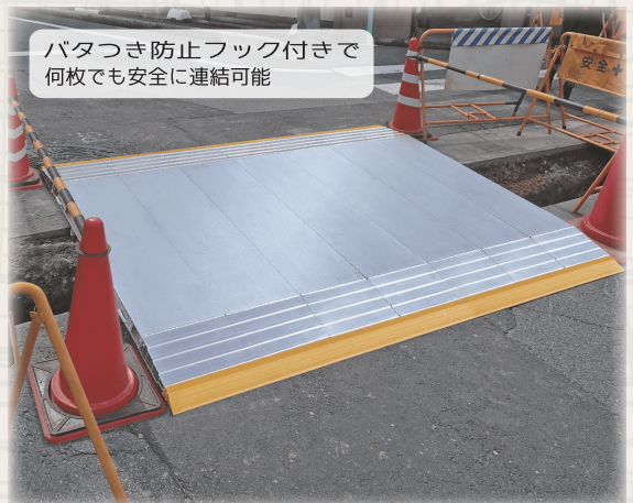
バタつき防止フック付きで 何枚でも安全に連結可能