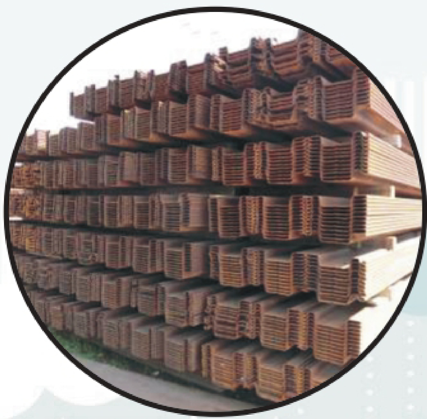
豊富なラインナップ