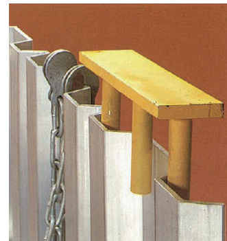
押さえ金具（リース対応）